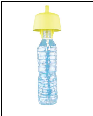
Piège avec cabochon sur bouteille plastique