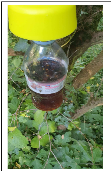
Piège avec cabochon rempli